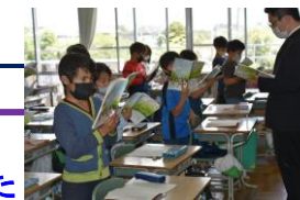
3年生授業参観 音読頑張りました。