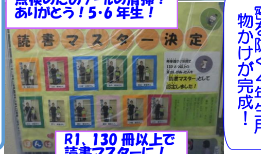
R1、130冊以上で 読書マスターに!