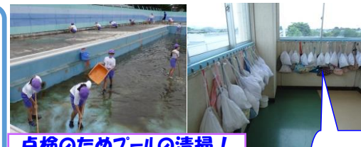
点検のためフールの清掃! ありがとうございます! 5・6年生!