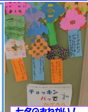
セタのおねがい! 「コロナがなくな りますように!」

引き続き、もし、発熱等、体調が悪い場合は、大事をとって、ご家庭で休養をしてください。あわせて、登校後に具合が悪くなった場合は、すぐに保護者の皆さんにお知らせいたします。ご協力よろしくお願い致します!