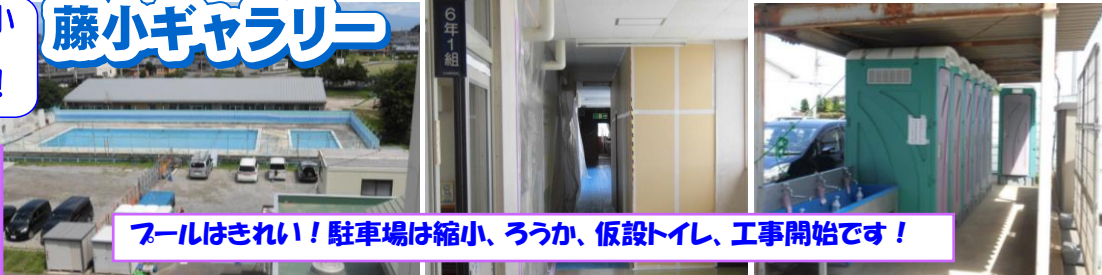
フールはきれい! 駐車場は縮小、ろうか、仮設トイレ、工事開始です!