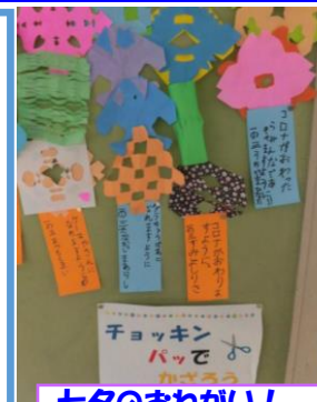
セタのおねがい! 「コロナがなくな りますように!」

引き続き、もし、発熱等、体調が悪い場合は、大事をとって、ご家庭で休養をしてください。あわせて、登校後に具合が悪くなった場合は、すぐに保護者の皆さんにお知らせいたします。ご協力よろしくお願い致します!