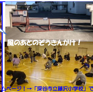
風のあとのぞうきんがけ!