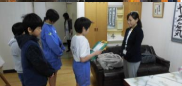
命の授業の助産師さん!