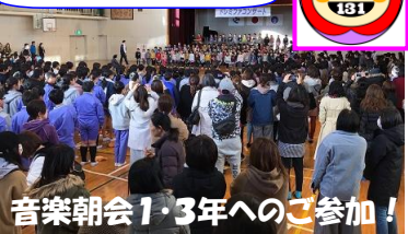
音楽朝会1・3年へのご参加!