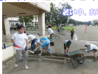
暑い中、ありがとう!うございました!

作業終了後、子供たち、保護者の皆さん、教職員、みんなで一緒に、笑顔で食べたアイス(H29から2年目です!)、とても美味しかったですね!