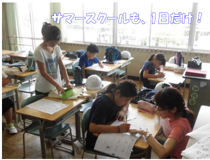
サマースクールも、1日だけ!

2学期当初も残暑が厳しくなることも想定されます。引き続き、日々の健康観察、水筒の用意等、ご配慮よろしくお願いいたします。