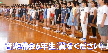
音楽朝会6年生(翼をください)!

※カラー版「学校だより」や行事等の様子はホームページ! →「深谷市立藤沢小学校」で検索!