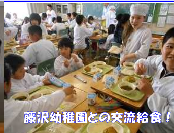
藤沢幼稚園との交流給食!