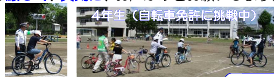
4年生(自転車免許に挑戦中)

5月11・12日は、深谷警察、交通指導員、市役所、交通安全母親の会、JAの皆さんのご協力により、自転車の乗り方、安全な登下校等について、学習しました。4年生は自転車運転免許に挑戦、深谷警察の方から「態度が一番よかった!」との感想をいただきました!学区が広く、交通量の多い道も増えています。ご家庭でも、子供たちを守るため、時には厳しく、真剣に、お声がけをお願いします。